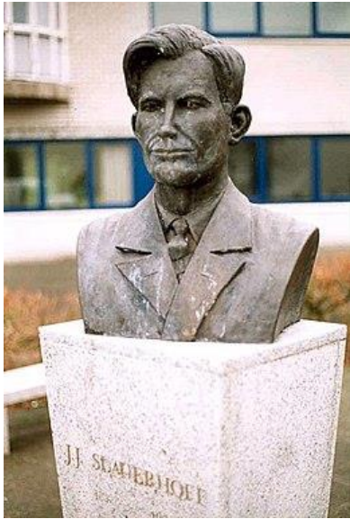
Buste van Slauerhoff in Huizum

Slauerhoffs werk werd na zijn dood alleen maar bekender.